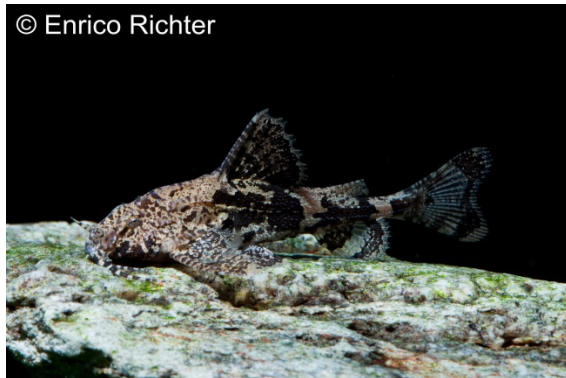
Schmetterlingswels ( Erethistes pusillus )

Ebenfalls aus Indien erhielten wir einen kleinen Wels aus der asiatischen Welsfamilie Erethistidae, aus der nur wenige Arten überhaupt aquaristisch bekannt sind. Erethistes pusillus wird häufig mit dem ähnlichen Hara hara verwechselt und fälschlich als dieser angesprochen, ist jedoch einfach anhand der Bedornung des Brustflossenstachels von diesem zu unterscheiden. Die Art ist außer in Indien auch noch in Bangladesh und Myanmar verbreitet und bewohnt bevorzugt schlammige Bereiche von Flüssen mit dichter Vegetation. Dem entsprechend fühlt sie sich im bepflanzten Aquarium sehr wohl, ist völlig friedlich und nicht schwierig zu pflegen, ja sogar im Aquarium zu vermehren. Die nur etwa 5 cm groß werdenden Welse können mit feinerem Lebend- und Frost- sowie mit Trockenfutter ernährt werden. Die Pflege kann in Leitungswasser bei 20-26 °C erfolgen.