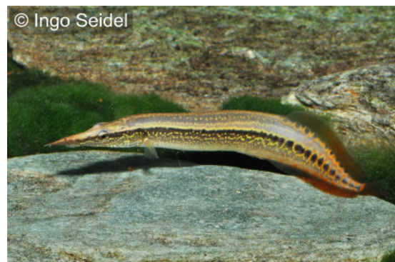
© Ingo Seidel Art.-Nr.: SZM408 + SZM4081