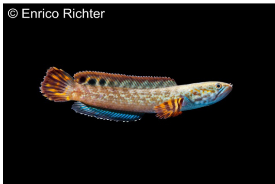
© Enrico Richter Flammen-Zwergschlangenkopf ( Channa aff. bleheri „Flame Fin/Chocolate“)

Einen ganz besonderen Vertreter der Schlangenkopffische der Gattung Channa erhielt aqua-global vor kurzem aus Indien. Auf den ersten Blick erinnert dieser Fisch in Körperform und Färbung sehr stark an Channa bleheri . Jedoch besitzen die noch recht jungen Exemplare jetzt schon einen markanten Unterschied, sie zeigen häufig gleich mehrere schwarze Flecken im hinteren Bereich der Rückenflosse. Bei guter Pflege färben sich diese Tiere im Alter extrem dunkel und bilden als Kontrast leuchtend rote Flossenränder aus. Dies hat Ihnen auch die Bezeichnung „Flame Fin“ eingebracht. Optimal für die Pflege scheint eine in den Wintermonaten auf etwa 16-18 °C abgesenkte Wassertemperatur zu sein. Die Tiere dürften nur eine Maximallänge von etwa 20 cm erreichen.