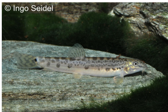
Indischer Steinbeißer ( Lepidocephalichthys thermalis )

Die Vertreter der Gattung Lepidocephalichthys sind tropische Verwandte der Steinbeißer der Gattung Cobitis und mit mehr als 20 Vertretern auch eine recht artenreiche Gruppe. Aus Sri Lanka konnten wir nun L. thermalis importieren, der auch in Indien weit verbreitet ist und deshalb den Trivialnamen Indischer Steinbeißer trägt. Die friedliche und gesellig lebende Art sollte zumindest in einer kleinen Gruppe gepflegt werden und erreicht eine Maximallänge von etwa 8 cm. Sie bevorzugt feinen Bodengrund, in den sie sich gerne eingräbt und in dem sie nach Nahrung gründelt. Der Indische Steinbeißer sollte bei etwa 22-26 °C gepflegt werden und frisst problemlos Trockenfutter.