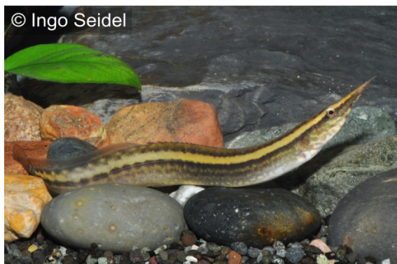
Punktlinien-Stachelaal ( Macrognathus lineatamaculatus ), WF links, NZ rechts

Der letzte Import des in Indien beheimateten Punktlinien-Stachelaals durch unsere Firma lag mittlerweile schon einige Jahre zurück, so dass wir uns freuten, diesen attraktiven Macrognathus wieder einmal auf den Importlisten zu entdecken. Erstaunlicherweise erhielten wir kurze Zeit nach den Importen auch noch europäische Nachzuchten dieser Art, die in der Jugend eine sehr hübsche rote Schwanzfärbung zeigt. Die attraktive Art zählt mit einer Maximallänge von unter 20 cm zu den kleineren und dem entsprechend am einfachsten zu pflegenden Stachelaalen. Sie liebt feinen Bodengrund, in den sie sich auch gerne eingräbt und ist sehr gesellig.